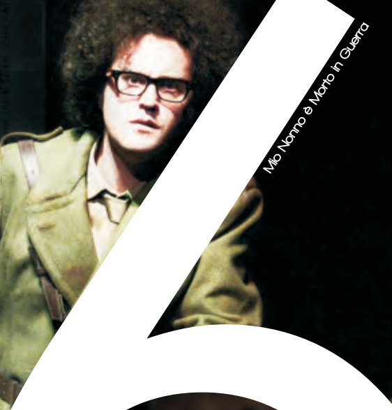
Mio Nonno è Morto in Guerra