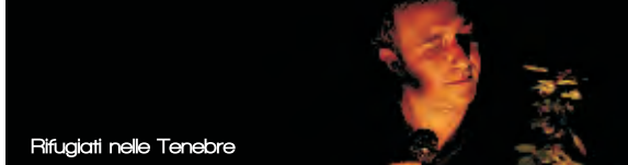
Rifugiati nelle Tenebre