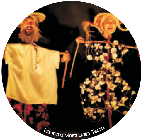
La terra vista dalla Terra