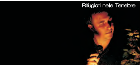
Rifugiati nelle Tenebre